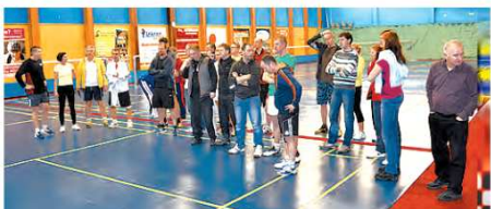
Účastníci sobotního turnaje.